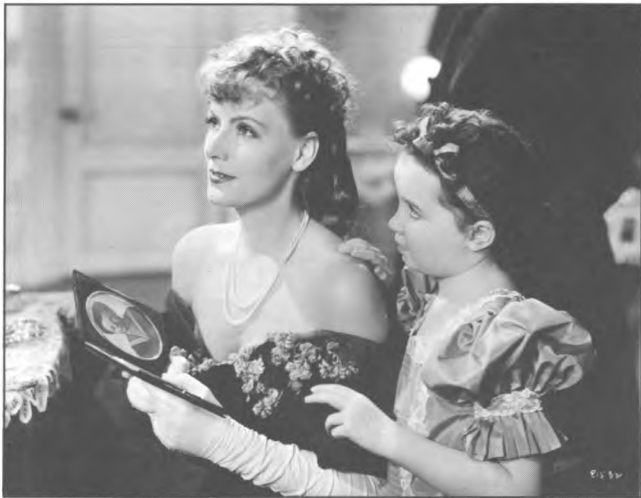
Photo de promotion avec Greta Garbo 1935. ANNA KARENINA, Clarence Brown, USA.