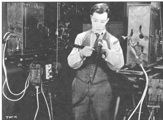
Photographie de plateau : scène du film prise par un photographe pendant le tournage 1924. SHERLOCK JR, Buster Keaton, USA.