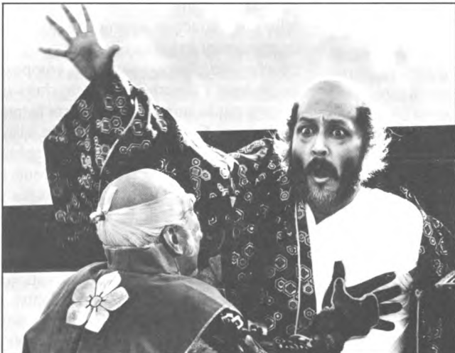
Photo de plateau donnée par un membre de la Cinémathèque 1980. KAGEMUSHA, Akira Kurosawa, Japon.