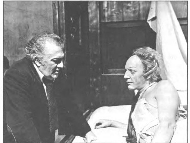
Photo de tournage insérée dans le dossier de presse provenant du distributeur : Fellini et Donald Sutherland en répétition 1976. IL CASANOVA DI FEDERICO FELLINI, Italie.