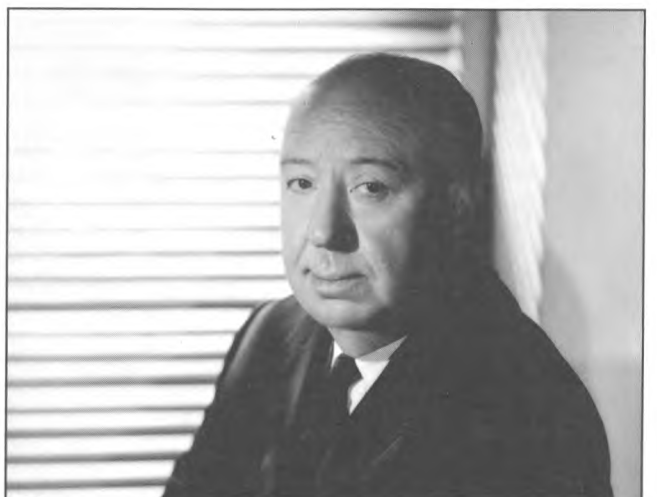
Portrait de cinéaste c. 1963. Alfred Hitchcock.