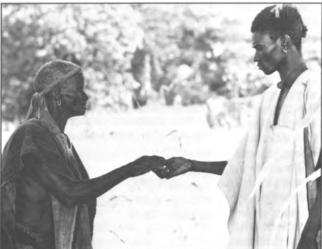
Photo de plateau offerte à la presse pour la première du film à Cannes 1987. YEELÉN, Souleymane Cissé, Mali.