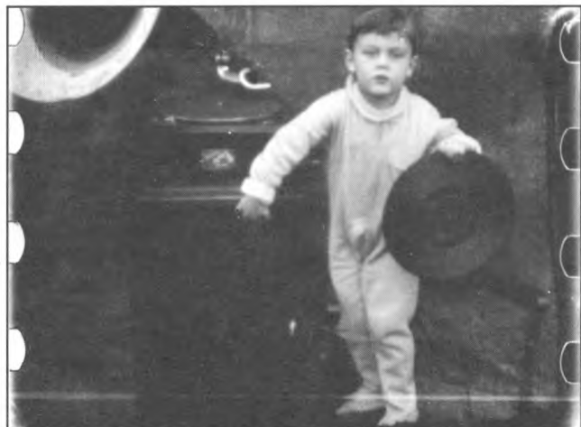
Photogramme : image extraite directement de la pellicule du plus ancien film québécois existant 1908. MES ESPÉRANCES, Léo-Ernest Ouimet, Québec.