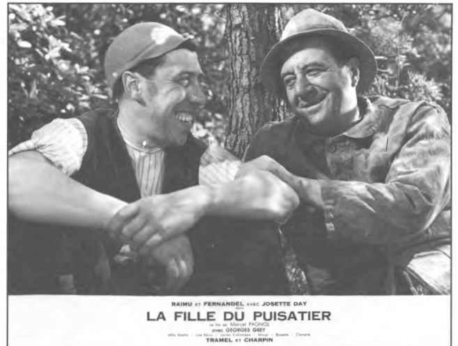
Photo publicitaire affichée à l'entrée des salles de cinéma 1940. LA FILLE DU PUISATIER, Marcel Pagnol, France.