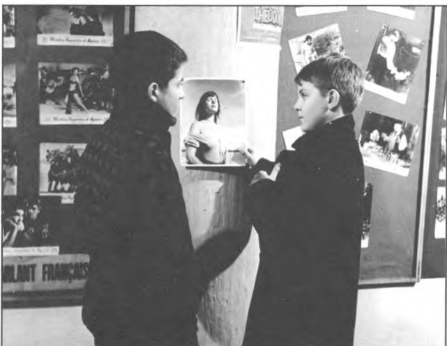
Photographie de plateau rappelant le culte voué aux photos de cinéma 1959. LES QUATRE CENTS COUPS, François Truffaut, France.