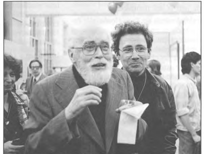
Photo d'événement : Maurice Blackburn et Claude Jutra à l'inauguration des nouveaux locaux de la Cinémathèque en 1982.