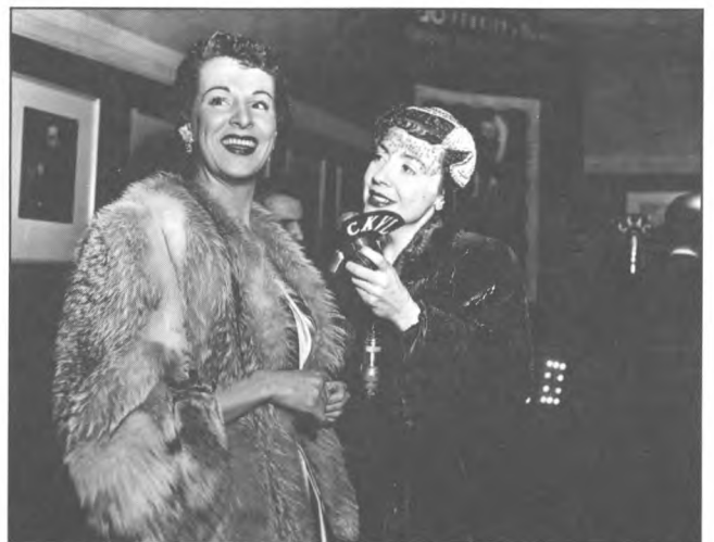
Photo d'événement : Denise Pelletier lors de la première de TIT-COQ de Gratién Gélinas au cinéma Saint-Denis le 20 février 1953, à Montréal.