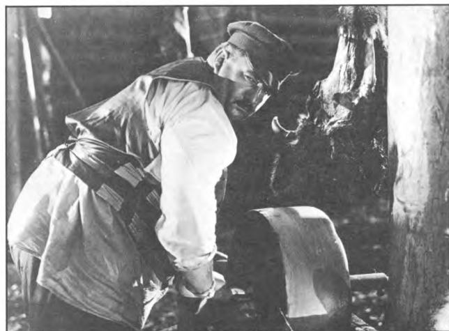
Photo de plateau provenant d'un échange avec le British Film Institute de Londres 1929. STAROIE I NOVOIE (La ligne générale), Serguei M. Eisenstein, URSS.