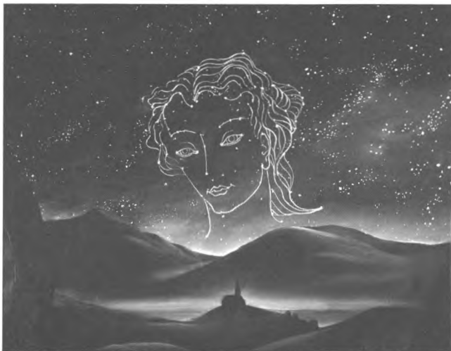
Image d'un film d'animation provenant de l'Office national du film 1946. LÀ-HAUT SUR CES MONTAGNES, Norman McLaren, Canada.