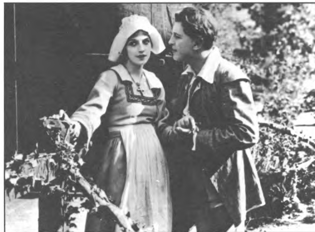
Photogramme (ou photo de plateau) du premier long métrage canadien 1913. ÉVANGÉLINE, E. P. Sullivan, W. H. Cavanaugh, Canada.